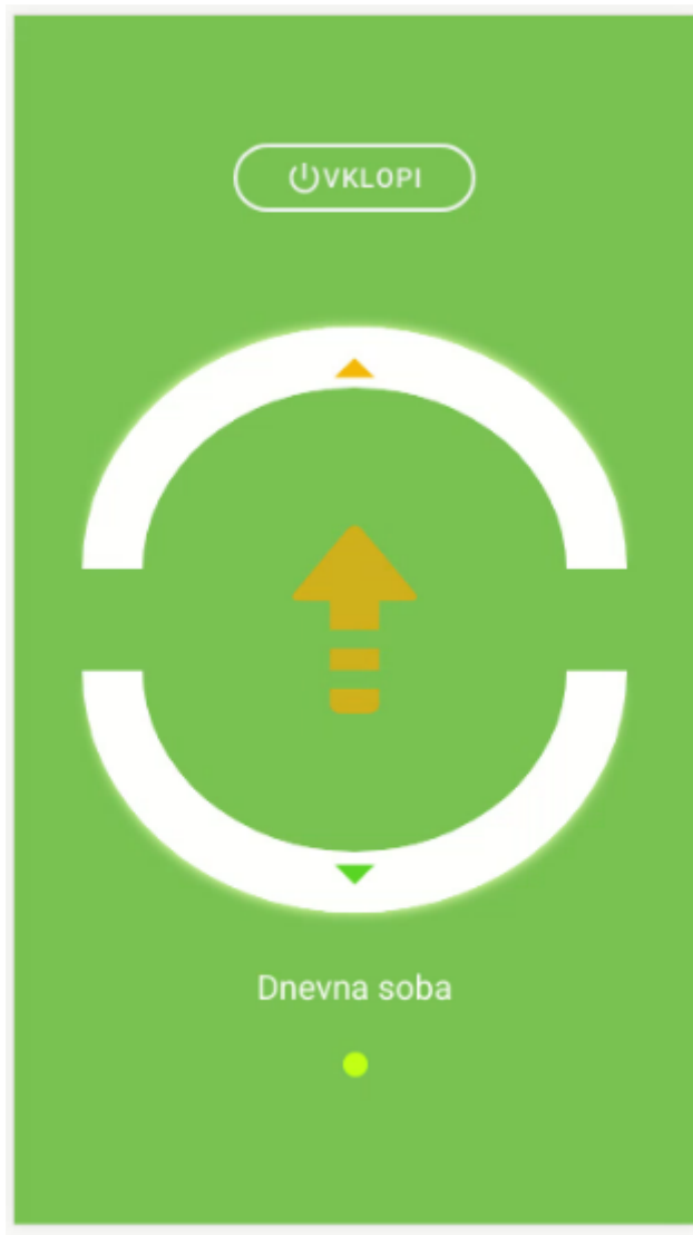
Slika 1: Nastavitveno okno za temperaturo termostata

Vsakem termostatu lahko kot povedano nastavimo temperaturo. Na glavnem zavihku imamo dve polkrogli, ki sta namenjeni za povečevanje (zgornja) in znižanje (spodnja) temperature. Na sredini se nahaja indikator, ki sporoča kaj se trenutno dogaja s temperaturo. Od spodaj je podan napis prostora, ki ga je uporabnik podal. V primeru več naprav lahko uporabnik poxdrsa po zaslonu (levo/desno) za pregled se ostalih termostatov. V primeru ko uporabnik podrsa od zgoraj navzdol se odpre zavihek za nastavitve (je le zavihek, bo narejen v naslednji iteraciji). Trenutni izgled nastavitvenega okna lahko vidite spodaj: